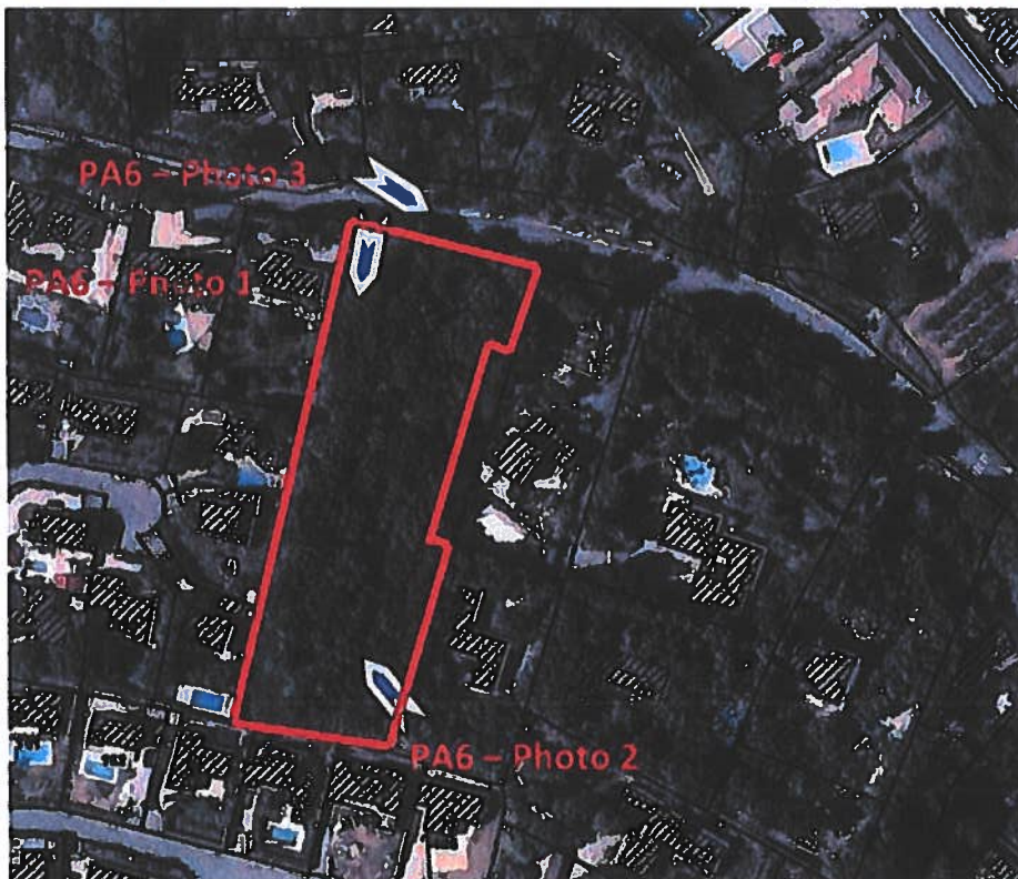
Image 1 : Carte IGN, Images aériennes et cadastrales issues du portail Géoportail